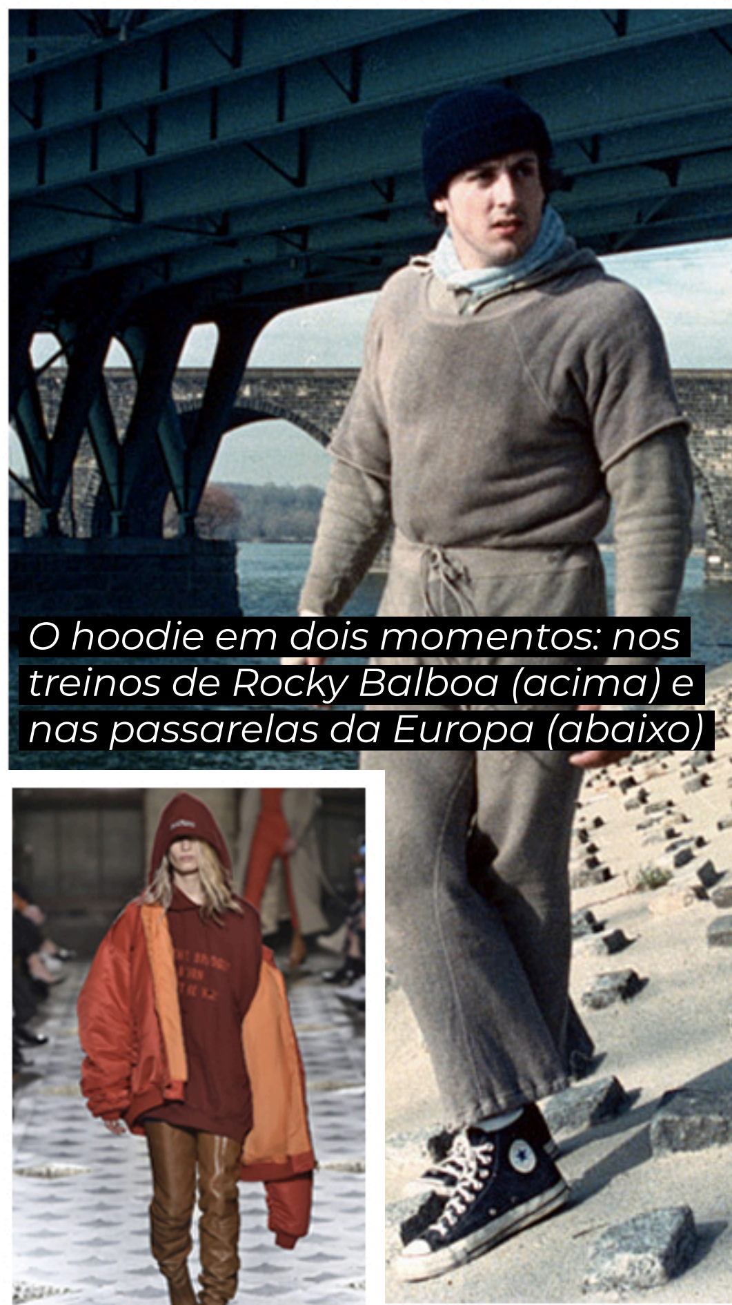
O hoodie em dois momentos: nos treinos de Rocky Balboa (acima) e nas passarelas da Europa (abaixo)

Ele é prático, aconchegante e, ao contrário do edredom, você consegue levar para qualquer lugar aonde for. Foi com essas características que o hoodie conquistou o coração das pessoas. Se você não reconheceu o nome, basta olhar na foto ao lado: trata-se do icônico mole tom com capuz, que em geral traz um bolso contínuo frontal no qual é possível aquecer a mão em dias muito frios. O hoodie surgiu neste formato no início de 1930, nos EUA, entre os operários de Nova York. Mas foi a partir da década de 1970, com o surgimento da cultura hip-hop, que o hoodie virou um símbolo fashion. Sua presença no filme "Rocky", de 1976, também ajudou a popularizá-lo no mundo esportivo. Avançando algumas décadas, hoje até mesmo os glamurosos desfiles europeus têm reverenciado o hoodie, uma peça essencial que todo homem precisa ter no armário, para enfrentar com estilo e casualidade os dias frios do ano. ◆